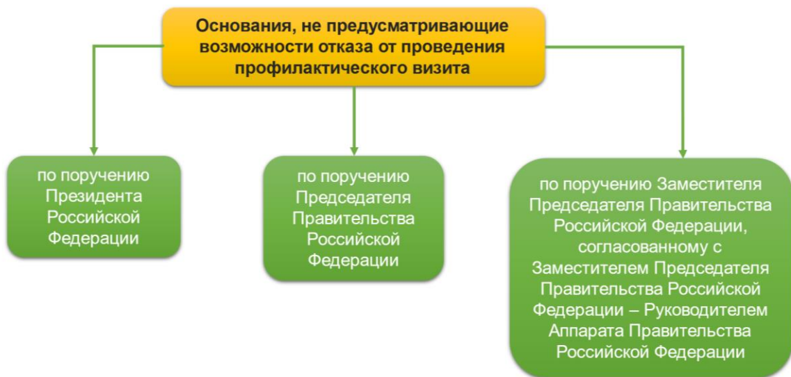
Рис. 2. Основания, не предусматривающие возможности отказа от проведения профилактического визита

Дополнительно установлено, что до 2030 года в рамках видов государственного контроля (надзора), муниципального контроля, порядок организации и осуществления которых регулируются Федеральным законом № 248-ФЗ, в отношении контролируемых лиц по определенным основаниям могут быть проведены профилактические визиты, не предусматривающие возможность отказа от их проведения (рис. 2).