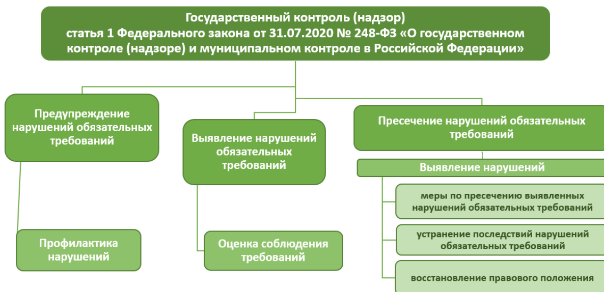
Рис. 1. Организация государственного контроля (надзора)

Согласно статье 1 Федерального закона от 31 июля 2020 года № 248-ФЗ «О государственном контроле (надзоре) и муниципальном контроле в Российской Федерации» (далее – Федеральный закон № 248-ФЗ) под государственным контролем (надзором), муниципальным контролем в Российской Федерации понимается деятельность контрольных (надзорных) органов, направленная на предупреждение, выявление и пресечение нарушений обязательных требований, осуществляемая в пределах полномочий указанных органов посредством профилактики нарушений обязательных требований, оценки соблюдения гражданами и организациями обязательных требований, выявления их нарушений, принятия предусмотренных законодательством Российской Федерации мер по пресечению выявленных нарушений обязательных требований, устранению их последствий и (или) восстановлению правового положения, существовавшего до возникновения таких нарушений (рис. 1).