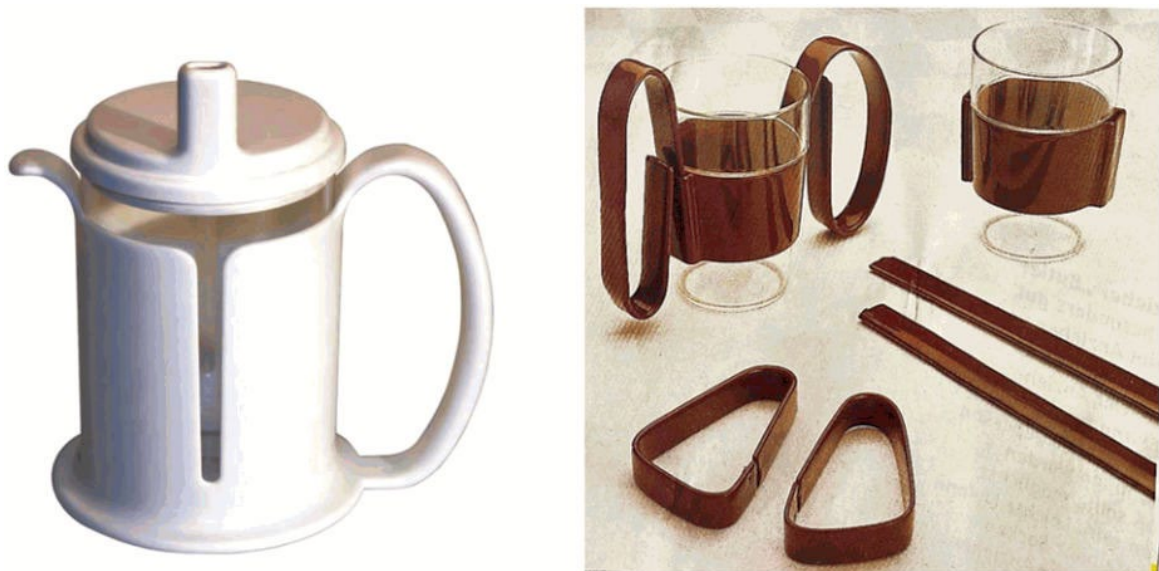
Рисунок 9 - Пример РБП для питья: стаканы, доступные для людей с ослабленной хватательной функцией руки

3.1.25 реабилитационные свойства бытовых приборов: Специальные свойства бытовых приборов, определяющие их основную функцию (назначение), позволяющие (помогающие) человеку с ограничением жизнедеятельности - пользователю этими бытовыми приборами, реализовывать свой реабилитационный потенциал.