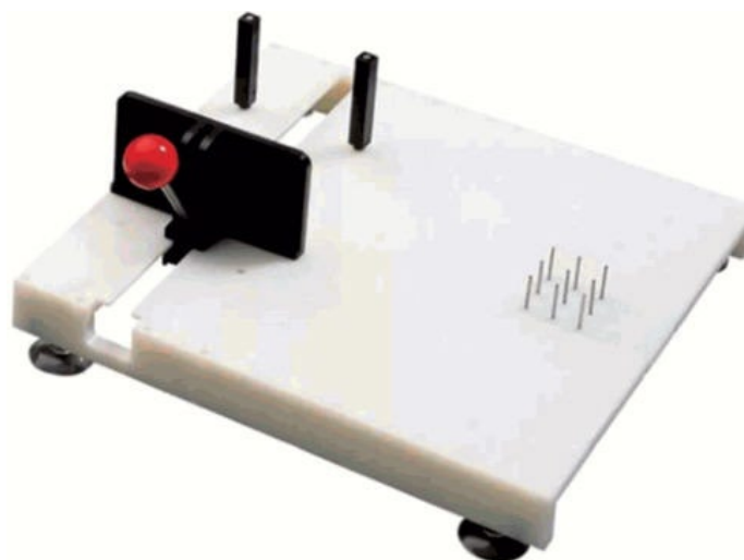
Рисунок 4 - Пример РБП для приготовления пищи: удерживающая кухонная доска, снабженная присосками и фиксирующая в неподвижном положении обрабатываемые продукты

Примечание - Пример РБП на присосках приведен на рисунке 4.