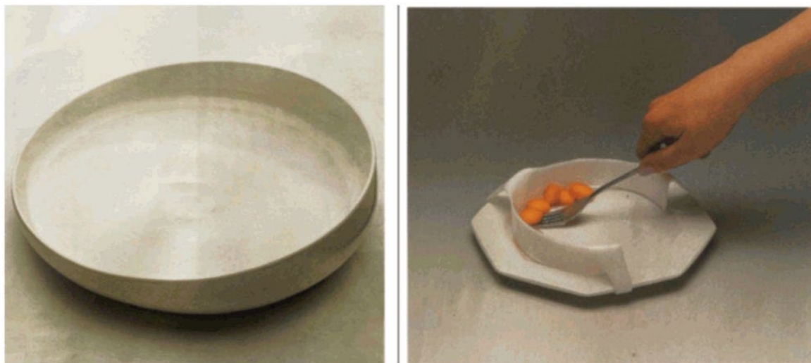
Рисунок 7 - Пример РБП для еды: оградитель тарелки, предотвращающий соскальзывание пищи с тарелки во время еды

Примечание - Пример оградителя тарелок приведен на рисунке 7.