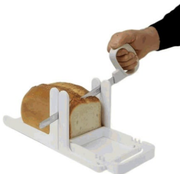
Рисунок 2 - Пример РБП для приготовления пищи: противоскользящая кухонная доска для резки продуктов ломтиками, фиксирующая в неподвижном положении обрабатываемые продукты

Примечание - Пример противоскользящей подставки приведен на рисунке 2.