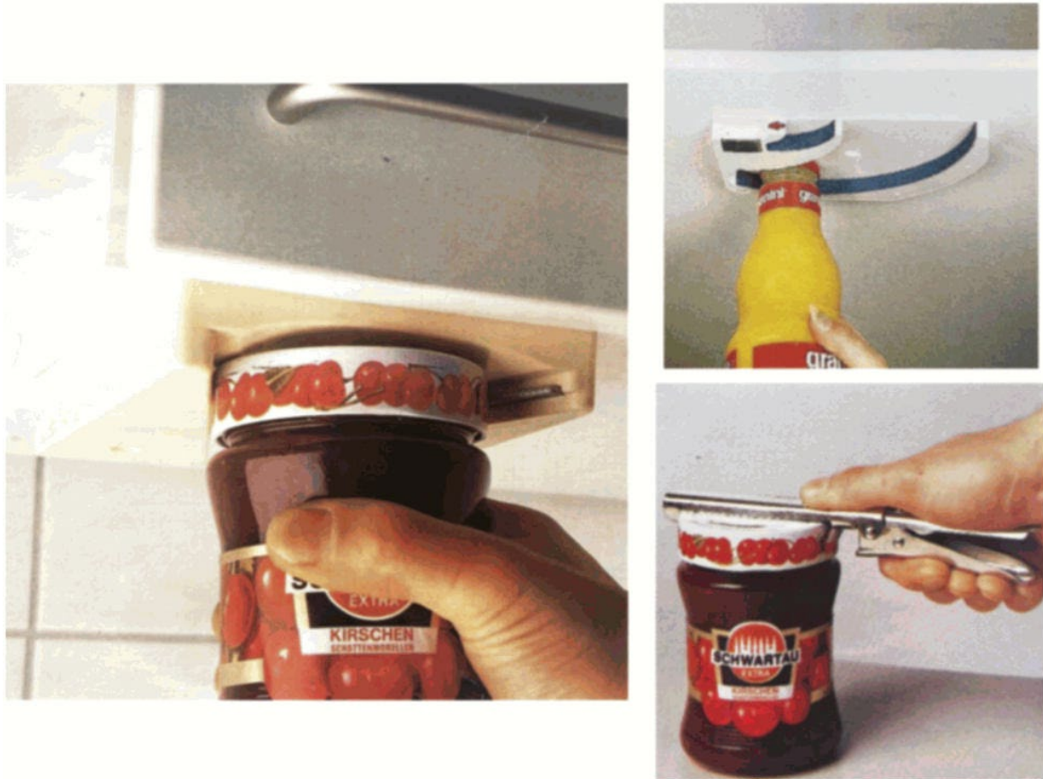
Рисунок 5 - Примеры РБП для приготовления пищи: приспособления для открывания банок, бутылок

3.1.21 реабилитационный держатель (адаптер) : РБП, закрепленный на предмете или прилагаемый к предмету, используемый человеком с нарушением функции верхних конечностей (кистей рук) для удерживания предмета и манипуляции с удерживаемым предметом.