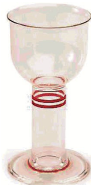
Рисунок 8 - Пример РБП для питья: стаканы, бокал с широкой подставкой, предотвращающей опрокидывание при неуверенном обращении пользователя с пониженной хватательной функцией и ослабленными мышцами рук

Примечание - Примеры РБП для питья приведены на рисунках 8 и 9.