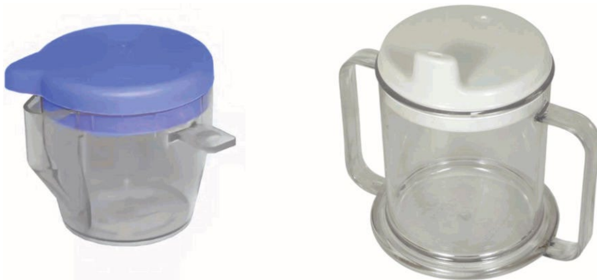
Рисунок 1 - Примеры РБП для приготовления пищи: дозаторы сахара и масла

Примечание - Примеры дозаторов приведены на рисунке 1.